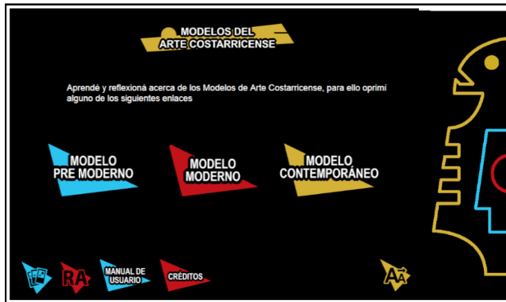
Imagen 3. Pantalla Modelos del Arte Costarricense.